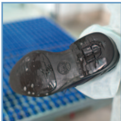
nettoyage humide et désinfection / Limpieza y desinfección