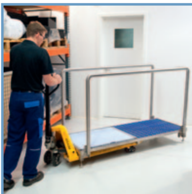
Transportable par chariot de manutention / Móvil con uso de una carretilla elevadora