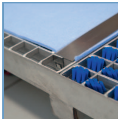
Le tissu absorbant qui est fixé par deux clips est rapidement échangeable / Fijación fácil con 2 pinzas, intercambio rápido